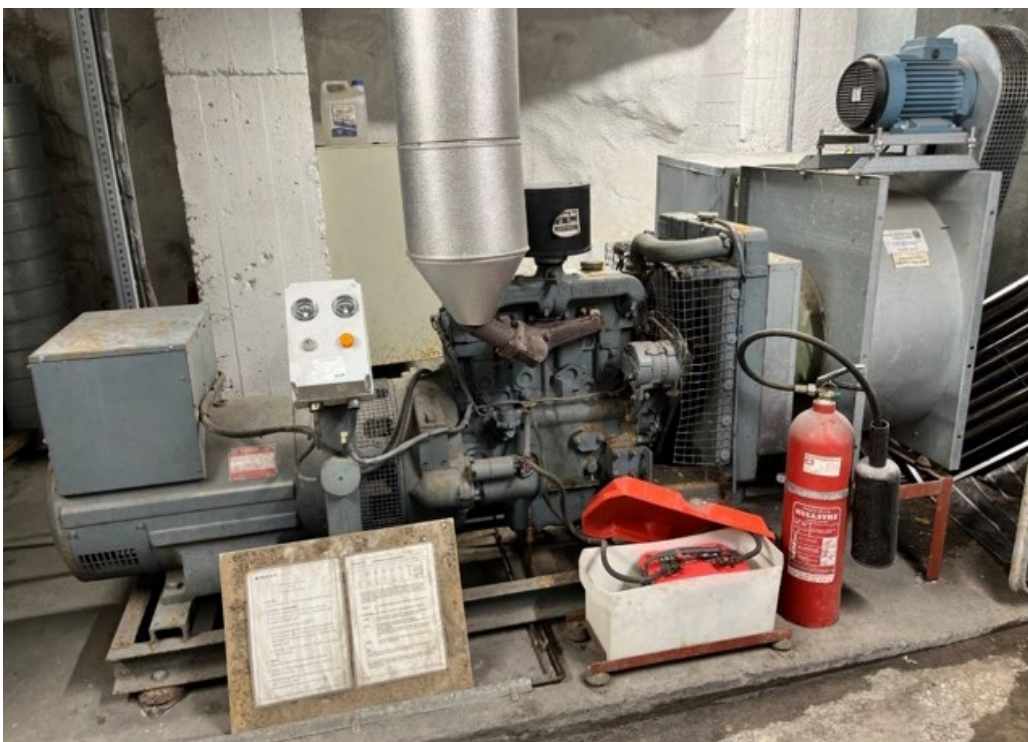
Bilde 2 Nødstrømsaggregat i et av Bymiljøetatens offentlige tilfluktsrom