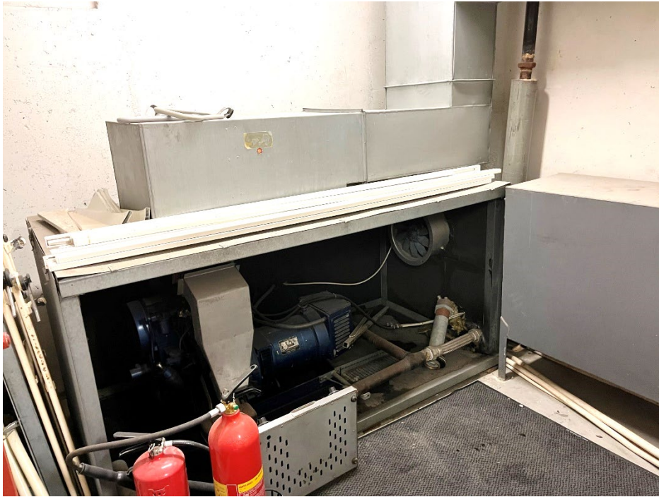
Bilde 6 Nødstrømsaggregat som ikke var i funksjon i et av Oslobyggs private tilfluktsrom