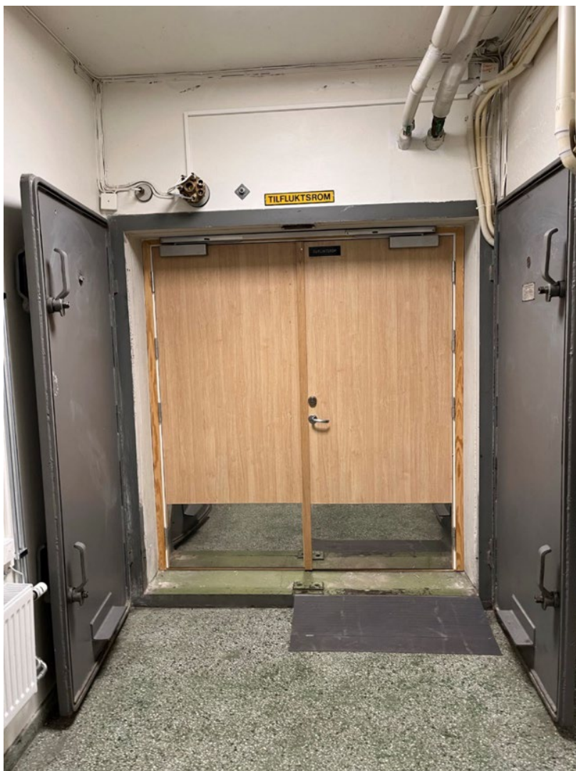
Bilde 10 Port til et av Oslobyggs private tilfluktsrom

Kommunerevisjonen har gjennomgått fire utleiekontrakter for bygg i Oslobyggs portefølje som inneholdt offentlige eller private tilfluktsrom. Flere av kontraktsbestemmelsene i leiekontraktene var likt eller tilnærmet likt formulert. Tilfluktsrom var omtalt i enkelte punkter i vedlegg til leiekontraktene. Det var felles for kontraktene at utleieren, altså Oslobygg, hadde ansvaret for drift og vedlikehold av spesifikt tilfluktsromutstyr som ventilasjon i tilfluktsrommene og nødstrømsaggregater. Det varierte mellom kontraktene om utleieren eller leietakeren hadde drifts- og vedlikeholdsansvaret for sanitærporselen, belysning, fastmonterte panelovner mv. i byggene, herunder i tilfluktsrommene.