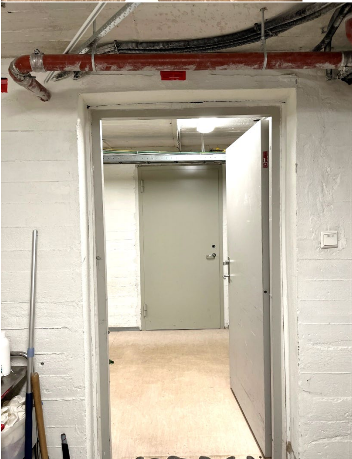
Bilde 9 Tilfluktsromdør fjernet og erstattet av vanlige dører i et av Oslobyggs private tilfluktsrom