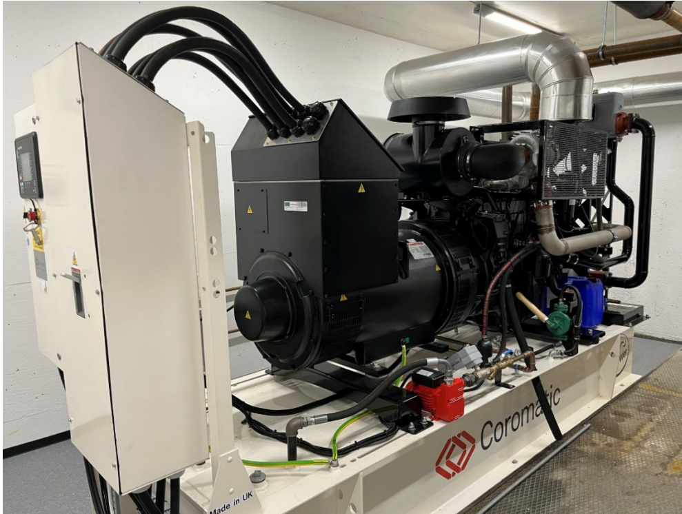
Bilde 4 Nødstrømsaggregat i et av Oslobyggs offentlige tilfluktsrom