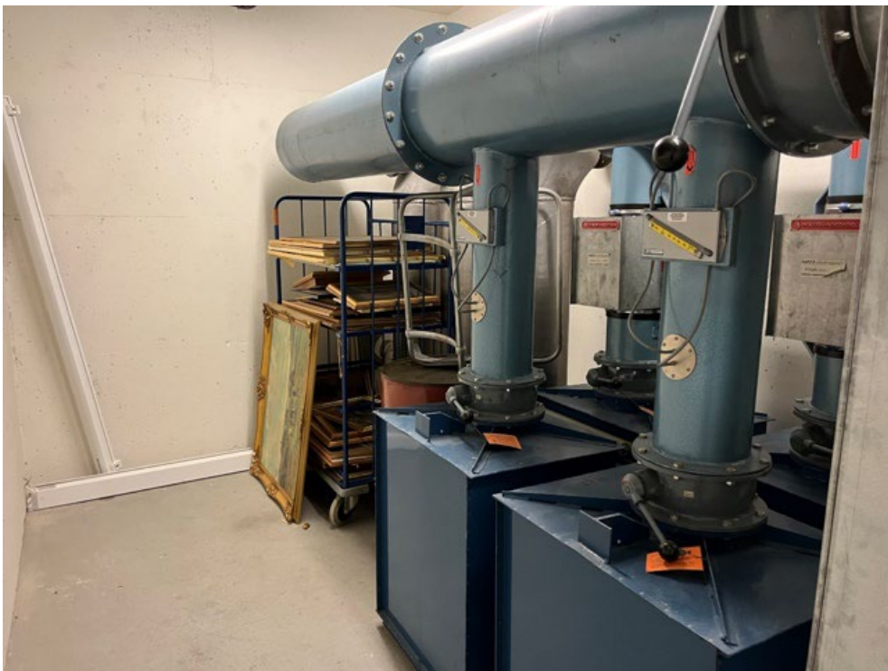
Bilde 7 ABC-filtre i et av Oslobyggs private tilfluktsrom