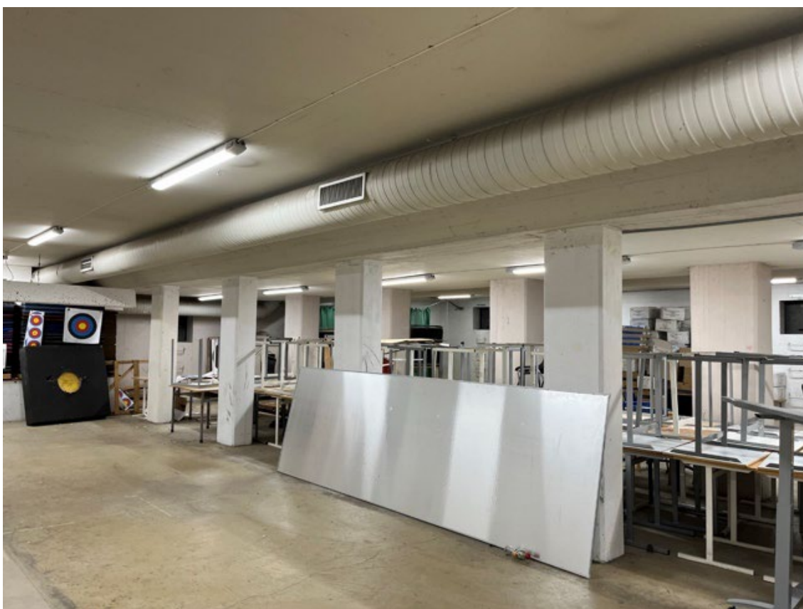
Bilde 12 Et av Oslobyggs private tilfluktsrom i bruk som lager

Kommunerevisjonen gjennomførte befaringer i to private tilfluktsrom. Det ene befant seg i et skolebygg. Deler av tilfluktsrommet ble benyttet til oppbevaring av løsøre som gamle møbler og IT-utstyr. Hoveddelen var framleid til et idrettslag på kveldstid om vinteren, men sto ubrukt på dagtid og i sommerhalvåret. Det andre private tilfluktsrommet var tilknyttet et sykehjem og ble benyttet som garderobe for de ansatte og lager.