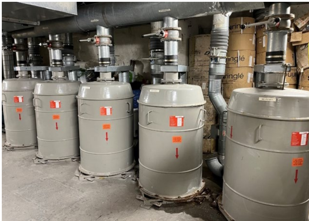
Bilde 3 ABC-filtre i et av Bymiljøetatens offentlige tilfluktsrom

Bymiljøetaten oppga at forvaltningsansvaret for de sju offentlige tilfluktsrommene i etatens portefølje ble fulgt opp gjennom ettersyn, vedlikehold, serviceavtaler og utleiekontrakter. Ifølge eiendomsforvalteren ble ettersyn av tilfluktsrom gjennomført både regelmessig og ved hendelser. Gjennomgangene skulle gjennomføres årlig for tilfluktsrom i fjellhaller og hvert tredje år for tilfluktsrom i betonganlegg. I tillegg ble det ved fornyelse av leiekontrakter gjennomført en befaring med leietakere for å sjekke at rommene var i orden. Bymiljøetaten hadde utarbeidet malen Tilsynsrapport for Bymiljøetatens bygninger , men ikke tatt den i bruk for tilfluktsrom. Ifølge eiendomsforvalteren kunne malen benyttes for å dokumentere ettersyn av tilfluktsrom.