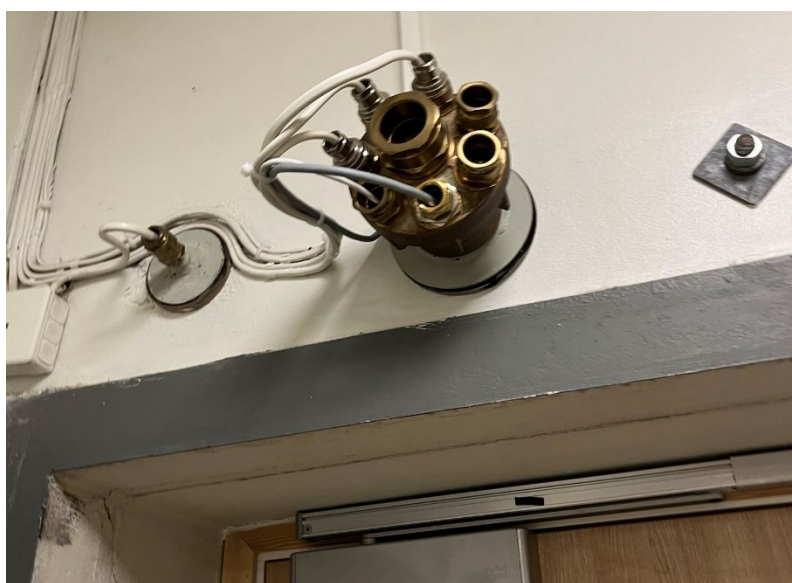
Bilde 14 Ledninger trukket på en lukket måte i et av Oslobyggs private tilfluktsrom