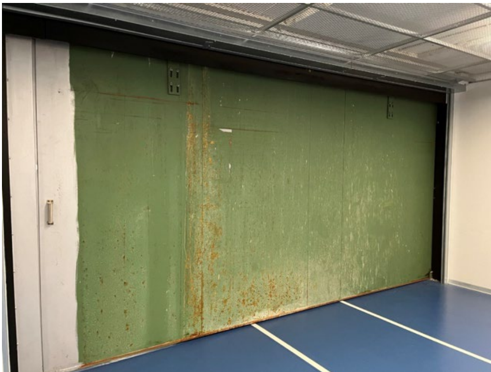
Bilde 5 Dør til et av Oslobyggs offentlige tilfluktsrom