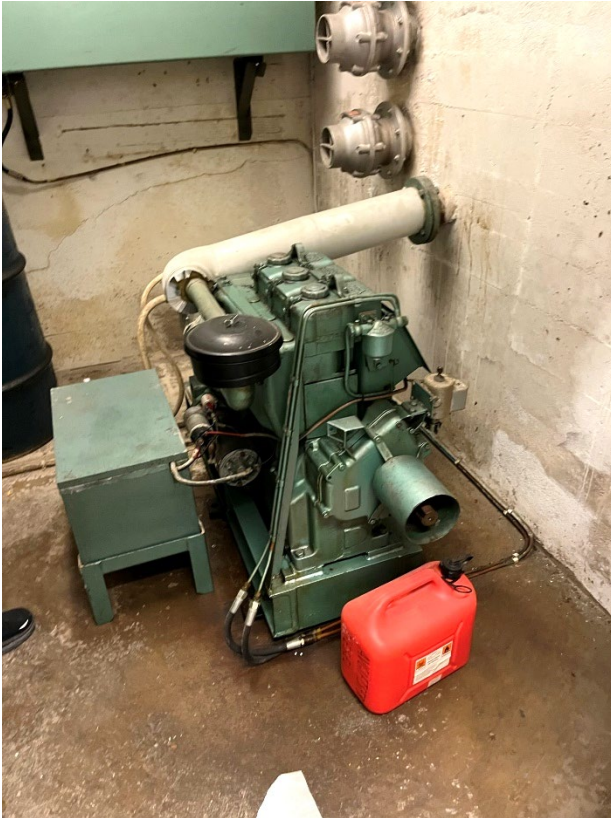
Bilde 8 Fungerende nødstrømsaggregat i et av Oslobyggs private tilfluktsrom