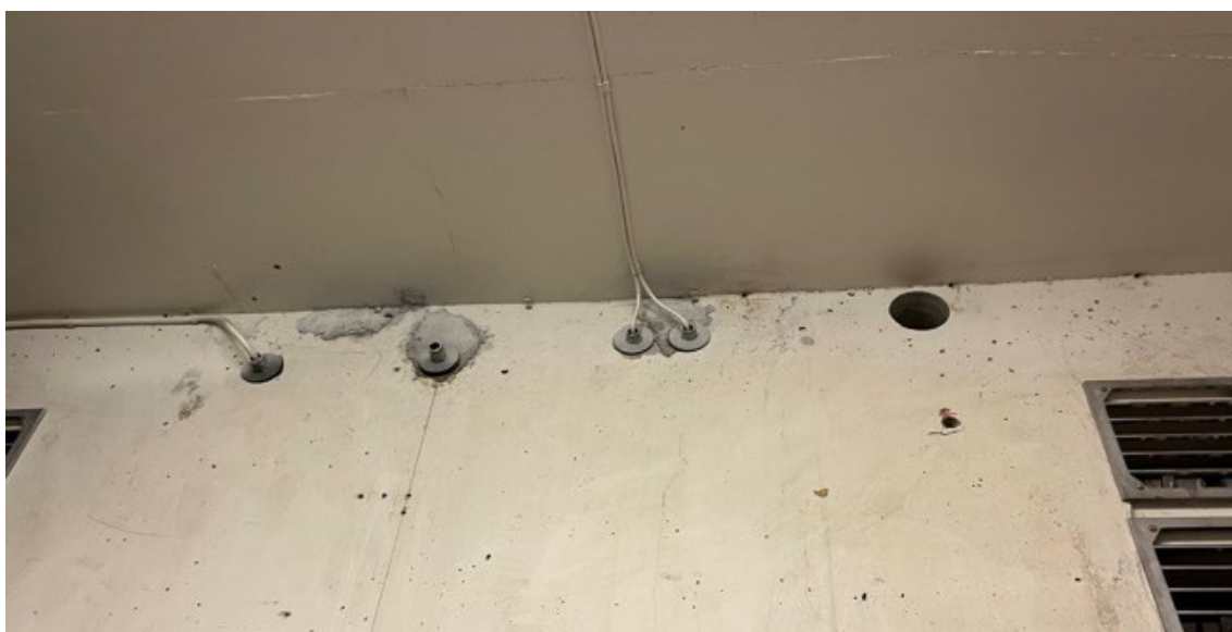
Bilde 13 Perforente vegger etter trekking av ledninger i et av Oslobyggs private tilfluktsrom

I det ene av de to private tilfluktsrommene var det trukket ledninger gjennom vegger uten at ledningene var lagt i tette kanaler. Ifølge kontrakten var det Oslobygg som hadde ansvaret for blant annet ventilasjon og kursopplegg for elektrisitet.