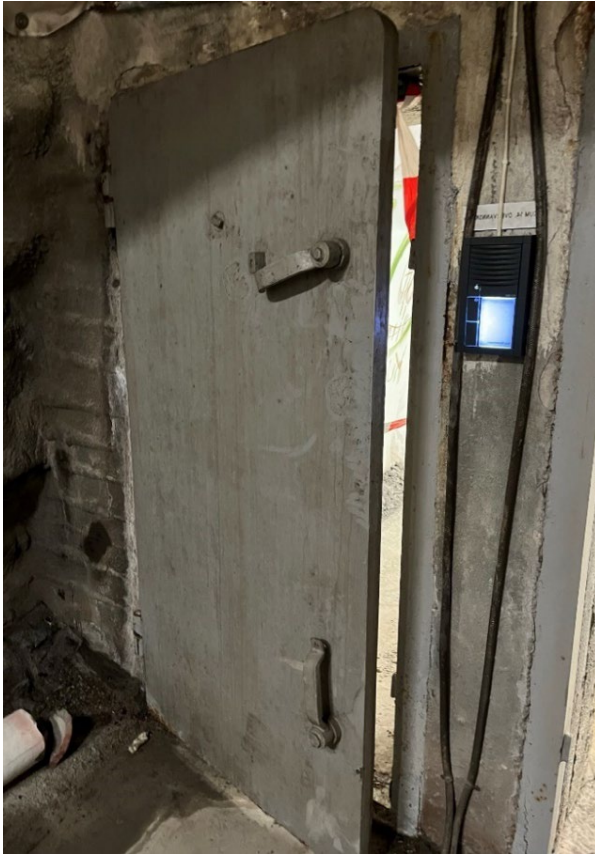
Bilde 1 Dør i et av Bymiljøetatens offentlige tilfluktsrom